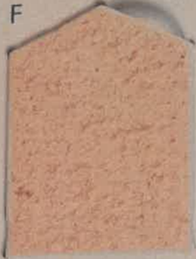
ROSE SOUTENU R.60