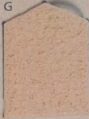
ROSE NACRÉ R.10