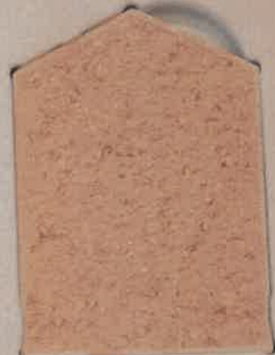
TERRE BEIGE T.70