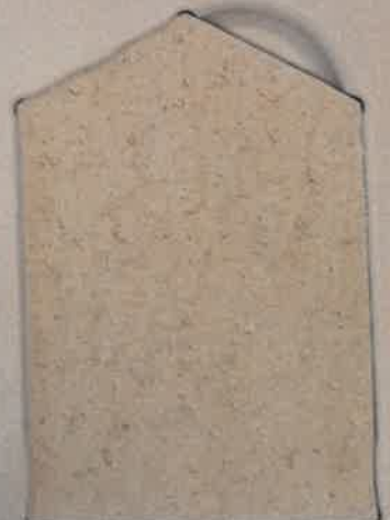
VERT PÂLE V.30