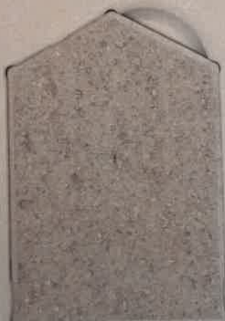
GRIS CENDRE G.50