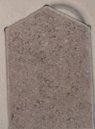
GRIS FUMÉ G.40