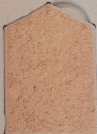
BEIGE ROSE PÂLE O.40