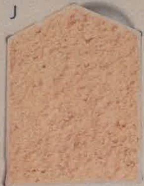
SABLE ROSÉ R.20