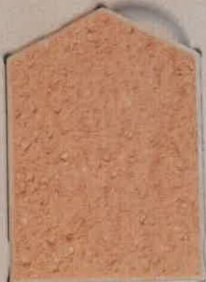
OCRE CLAIR O.70