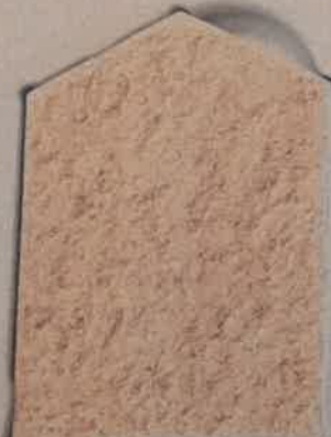
TERRE DE SABLE T.50