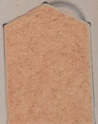
JAUNE ORANGE J.10