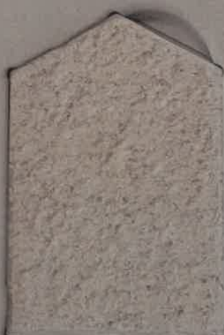
VERT ASTRAL V.20