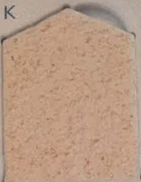
SABLE CLAIR T.20