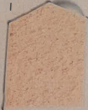
BEIGE ROSÉ O.50