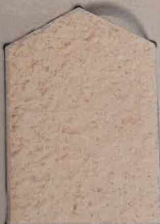
BLANC LUMIÈRE G.10