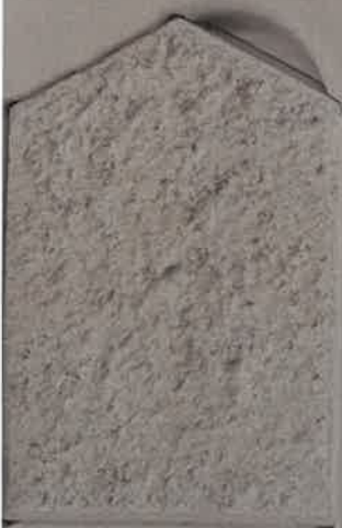
TERRE DE LUNE B.10