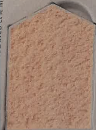
SABLE JAUNE J.40