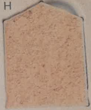
ROSE PARME R.30