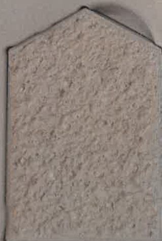
GRIS SOURIS G.30