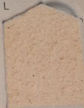
BEIGE ORANGE O.30