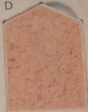
VIEUX ROSE R.50