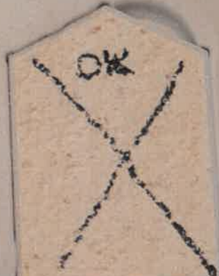
BLANC CASSÉ G.20