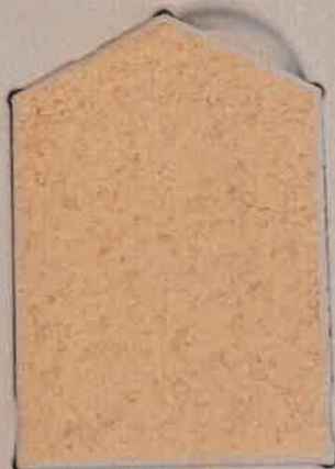
JAUNE PAILLE J.50