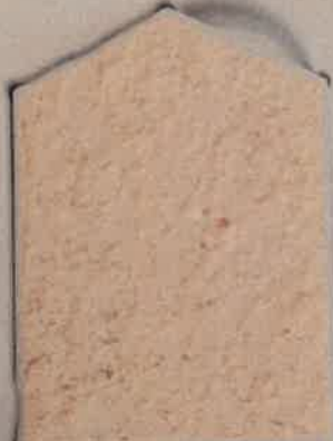
SABLE D'ATHÈNES J.39