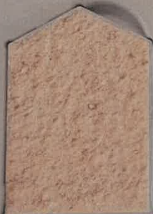
JAUNE PÂLE J.20