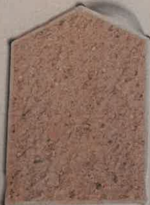
TERRE D'ARGILE T.30