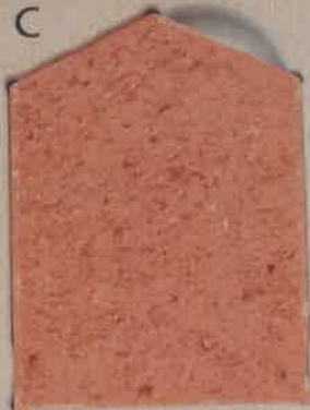
BRIQUE ROSE R.70