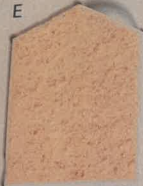
NACRE ORANGE O.20