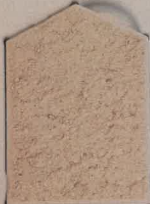
TERRE FEUTRÉE T.60