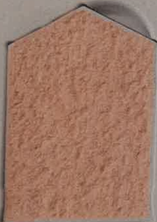
PÉTALE ROSE R.40