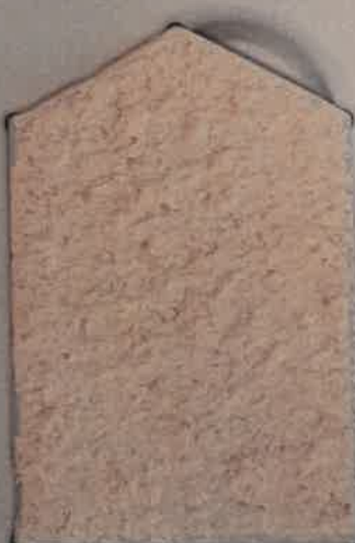
SABLE ORANGE T.40