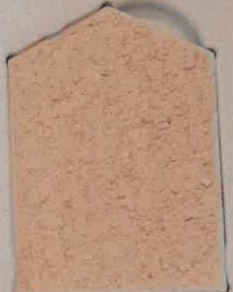
TERRE ROSÉE T.90