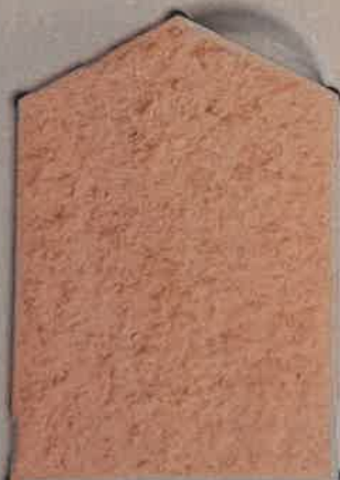
ROSE ORANGE O.60